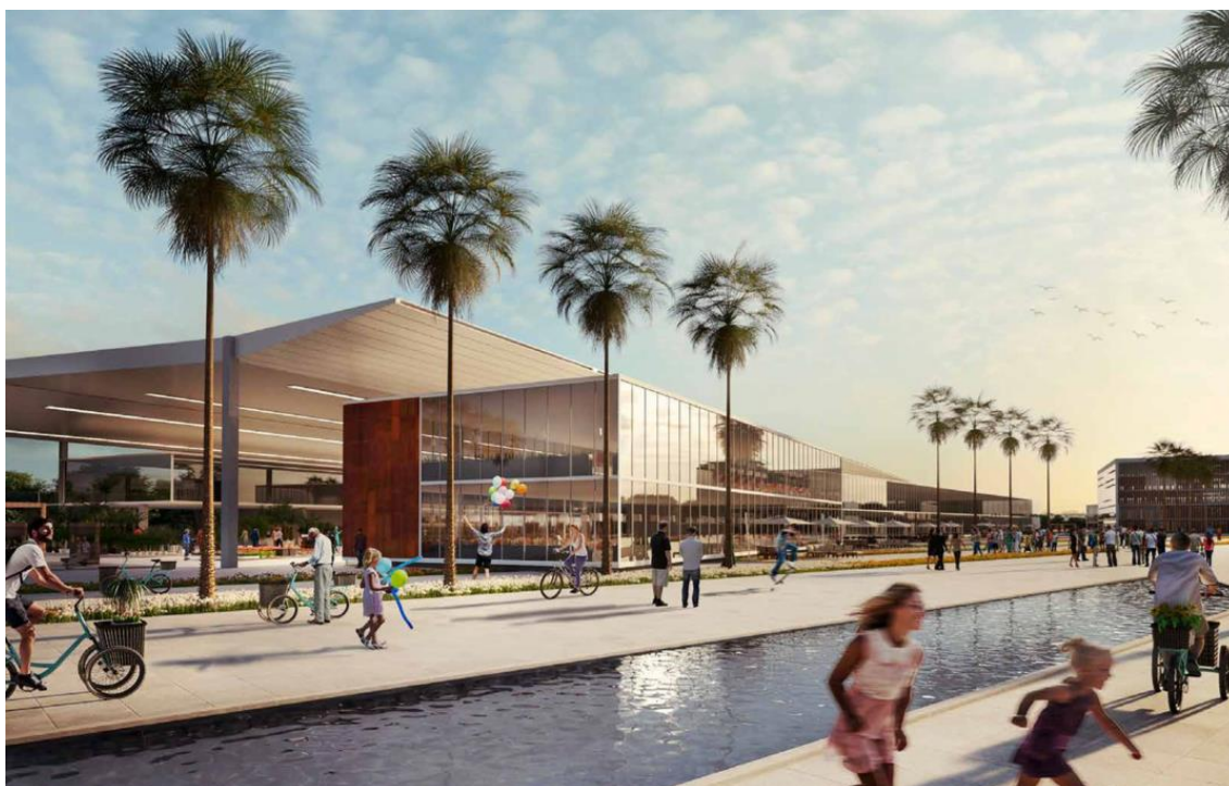
Vista do galpão de flores

Uma das novidades do Novo Ceasa em relação ao atual Ceagesp é que proteínas de origem animal, como carne bovina, suína, vísceras, aves e ovos também deverão fazer parte do mix de produtos ofertados (atualmente, há apenas peixaria). Entre as outras mudanças estão a adoção de medidas como a substituição de caixas de madeira por palets com chip, o reaproveitamento de resíduos, a geração de energia e o tratamento de água e de esgoto, além de locomoção por meio de carros e bicicletas elétricas e possíveis trilhas para caminhada.