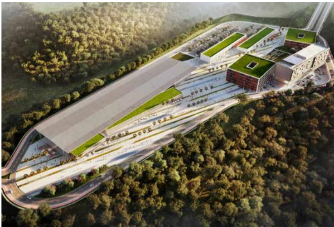
As edificações do platô 5 serão destinadas às atividades complementares: comercialização de flores, bancos, poupatempo, centro de convenções, entre outros.