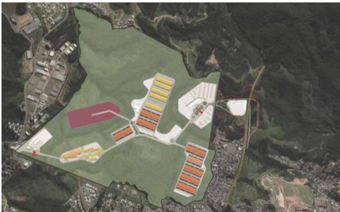
Perspectiva do complexo: do total de 406,68 hectares disponíveis no local, 289,82 são de área verde